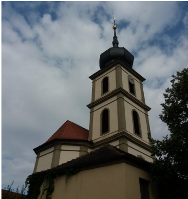
Kirche St. Cyriacus prägt das Ortsbild

In den Bauernkriegen spielte Sulzdorf eine tragische Rolle. Der Aufstand der Bauern endete im Sommer 1525 mit einer furchtbaren Niederlage in der letzten Schlacht auf den Feldern von Sulzdorf.