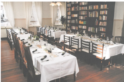
Im Landgasthof Odaia werden gerne Hochzeiten und Familienfeste gefeiert.